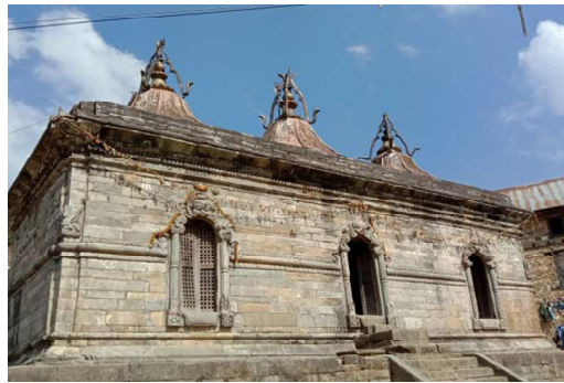
विकास संवाददाता थाहा नगर

मकवानपुरको थाहा नगरपालिका-९ चित्लाङस्थित ३ गजुर भएको शिवालयको मन्दिरबाट चार र दुङ्गेधाराबाट एउटा गरी पाँच मूर्ति चोरी भएका छन्। तीन गजुर भएको शिवालय चित्लाङ प्रहरी चौकी नजिकको मन्दिर हो। गत २८ पुस राति पाँचवटै