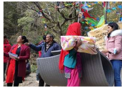
परिवारलाई एक/एकथान ब्याडकेट र म्याट्रिक्स वितरण गरेको थिइन्।

त्यसै गरि विद्यालयमा अध्ययनरत भाङ्खोरिया र ठोस्ने खालाका ४३